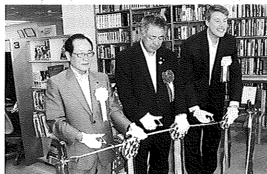
<アメリカン・シェルフ> オープニング・セレモニー 左より：朝長市長、小幡会長、チャドウィック領事