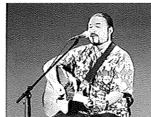
<エリック・リー ハワイアンライブ>