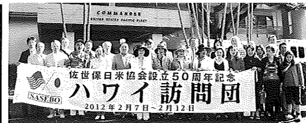
<ハワイ訪問> 平成24年2月7日～2月12日