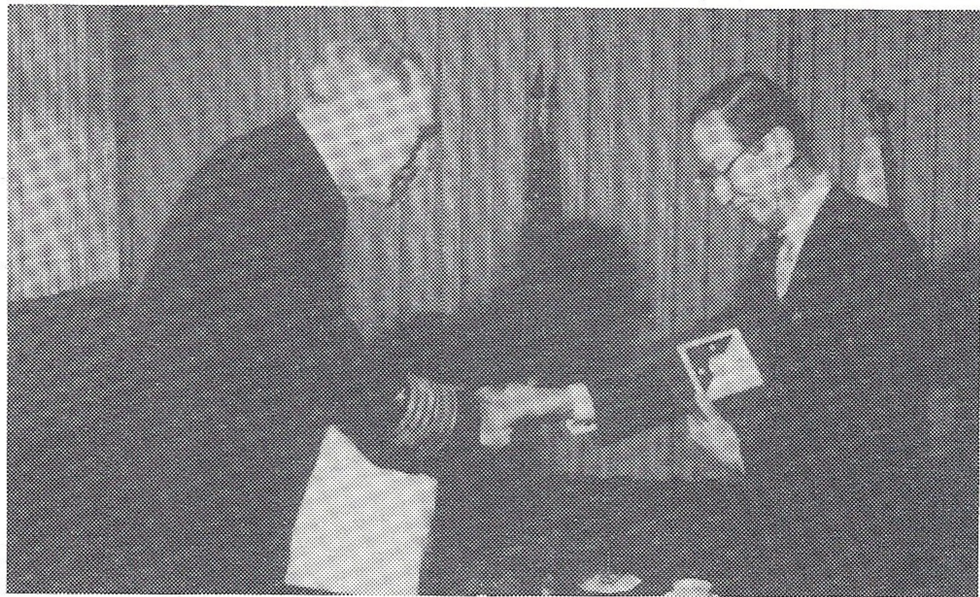
ケルソー大將より盾をもらう富永会長