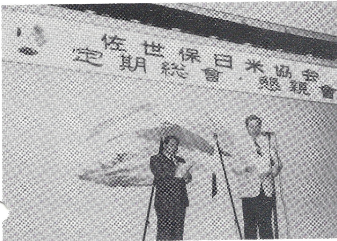
懇親会で挨拶されるコリンズ司令官