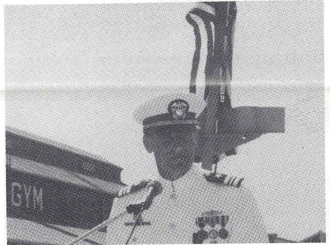
離任スピーチをするSKUDIN少佐