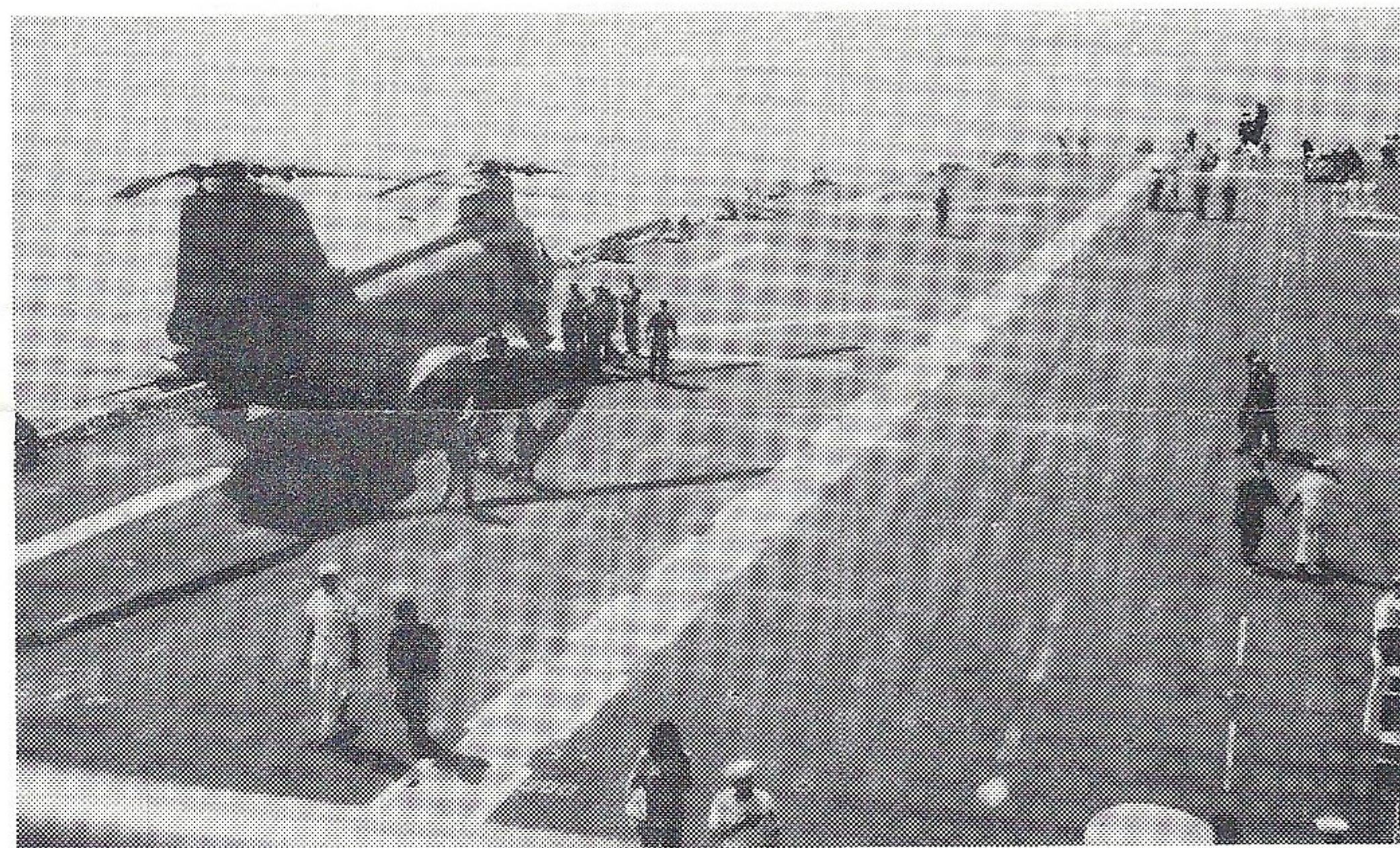
ベローウッド号の飛行甲板

また、普段はジャーマンタウン号に搭載されているL-CAC(上陸用ホバークラフト)も姿をみせたり、艦内での第7艦隊のバンド演奏など、長い航海をより楽しく過ごせるようたくさんの催しがありました。予定よりやや早く、午後2時過ぎ無事立神7岸壁に戻ってまいりました。