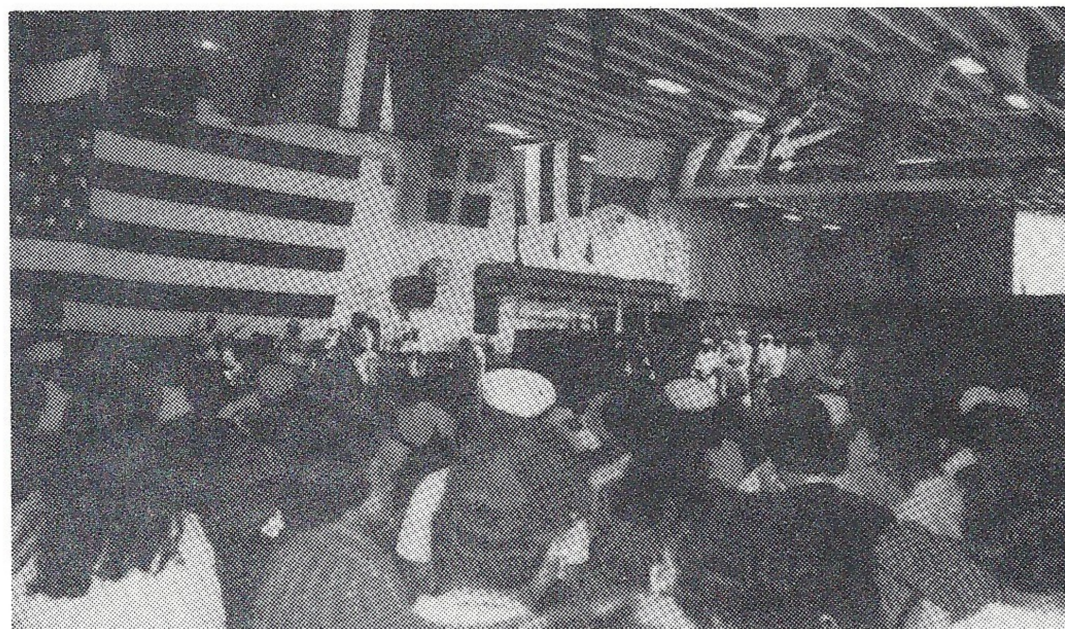
第7艦隊バンドの演奏

去る11月7日(月)モンデール駐日米国大使が、着任以来はじめて佐世保を訪問され、米海軍佐世保基地や佐世保USO等を見学されました。