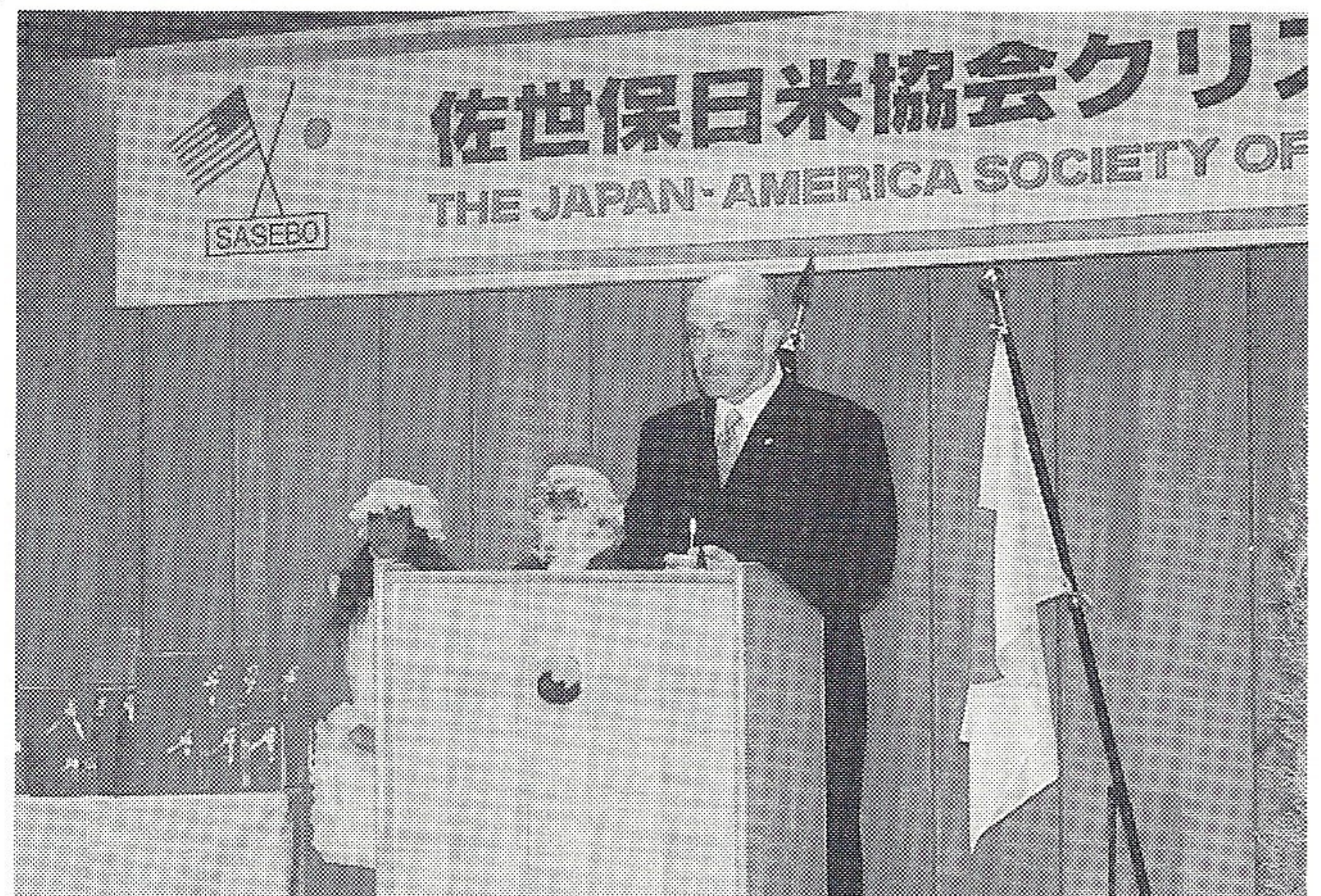
乾杯のご発声をされるジェームズ大佐 (米海軍佐世保基地司令官)