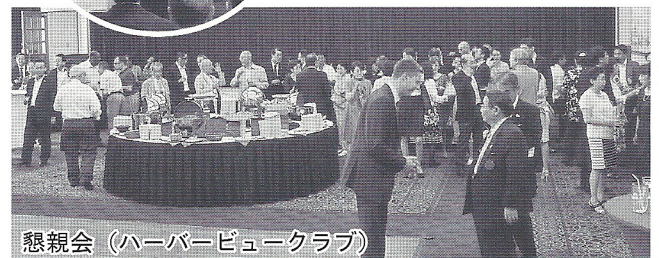
懇親会 (ハーバービュークラブ)