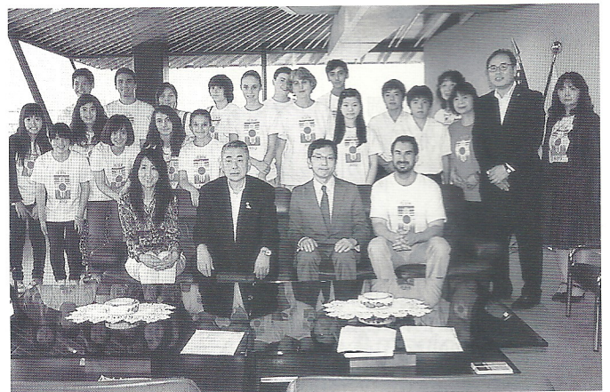
アルバカーキ市青少年訪問団 (親和銀行展望室にて記念撮影)