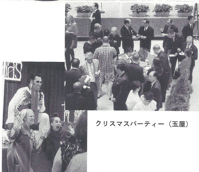
クリスマスパーティー（玉屋）

日 時：平成27年12月15日（火） 会 場：佐世保玉屋7Fホールにて 参加人数：203名（米海軍等招待者42名含む）